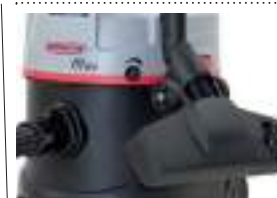
Крепление для дополнительных аксессуаров.