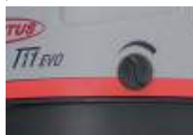
Регулировка мощности всасывания