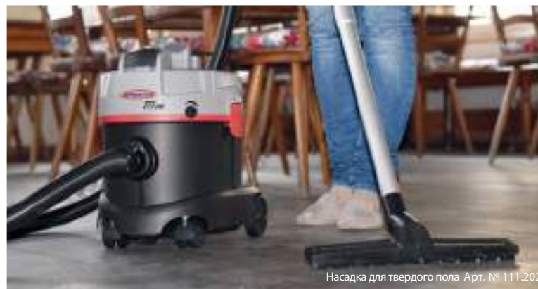
Насадка для твердого пола Арт. № 111.202