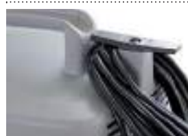
Место для хранения шнура с фиксацией.