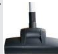
Турбо-щетка 284 мм Арт. № 106.012