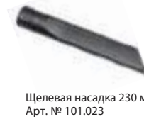
Щелевая насадка 230 мм Арт. № 101.023