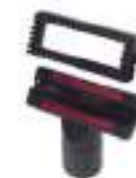
Мебельная насадка Арт. № 106.028