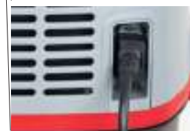
new Комфортность: подключаемый шнур питания длиной 10 м.